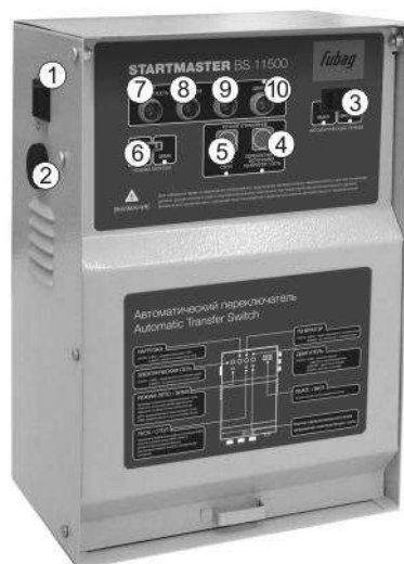
Startmaster BS 11500